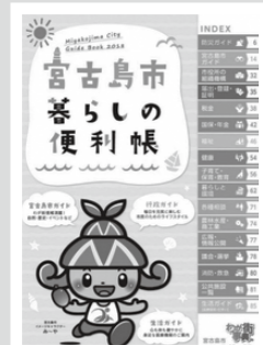
▲ 2018年発行の暮らしの便利帳の表紙

宮古島市では、行政サービスなどを掲載した宮古島市「暮らしの便利帳」を、株式会社サイネックスとの官民協働により発行します。